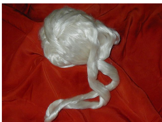
Illustration 5: Soie cardée et filée