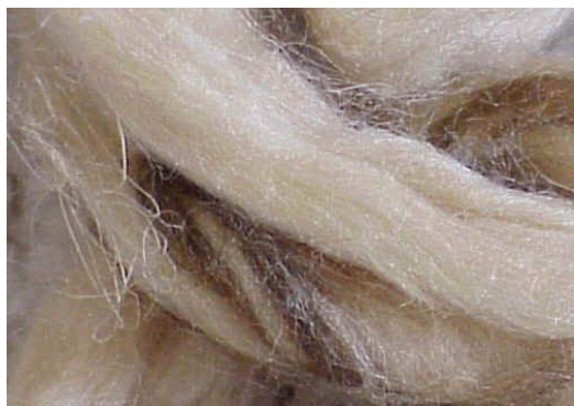
Illustration 4: Soie sauvage cardée