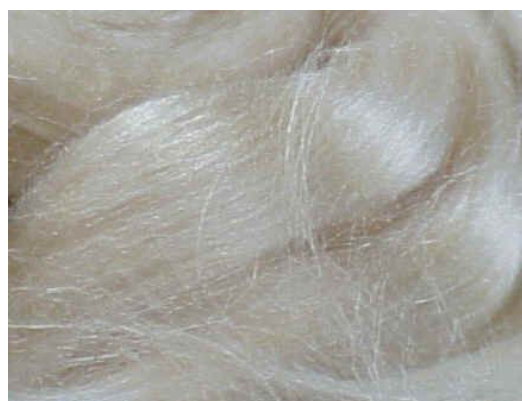
Illustration 3: Tussah cardé