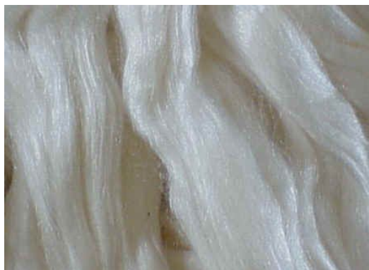
Illustration 2: Soie cardée du Bombyx Mori