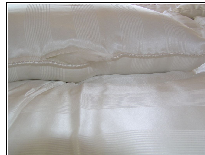
Illustration 7: Regard existant sur les couettes et oreillers montrant la garniture en soie cardée.