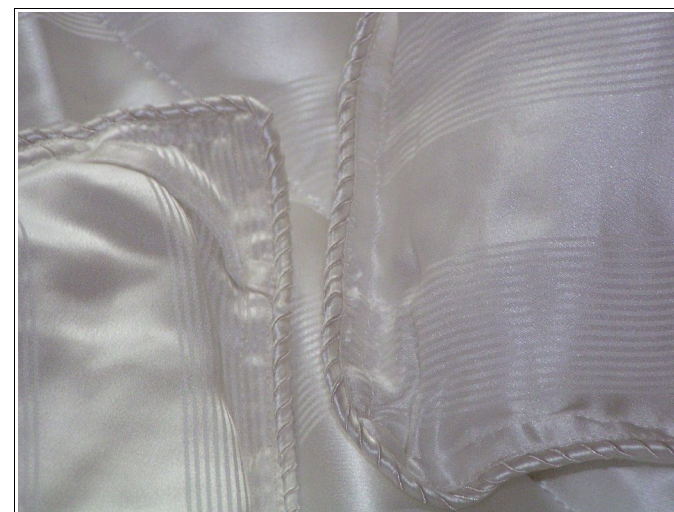
Illustration 6: Finissage luxueux des couettes et oreillers avec garniture et tissu 100% soie.