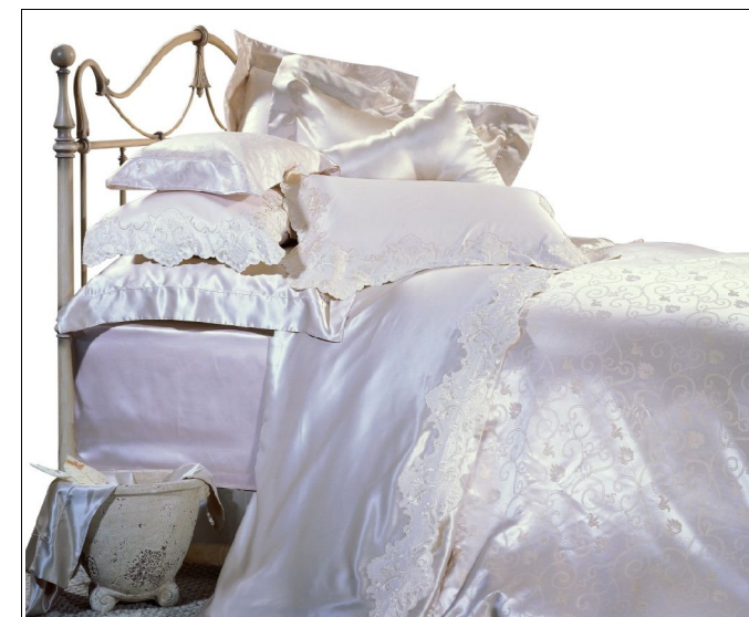
Illustration 9: Ensemble linge de lit jacquard, 5 p. 100% soie.